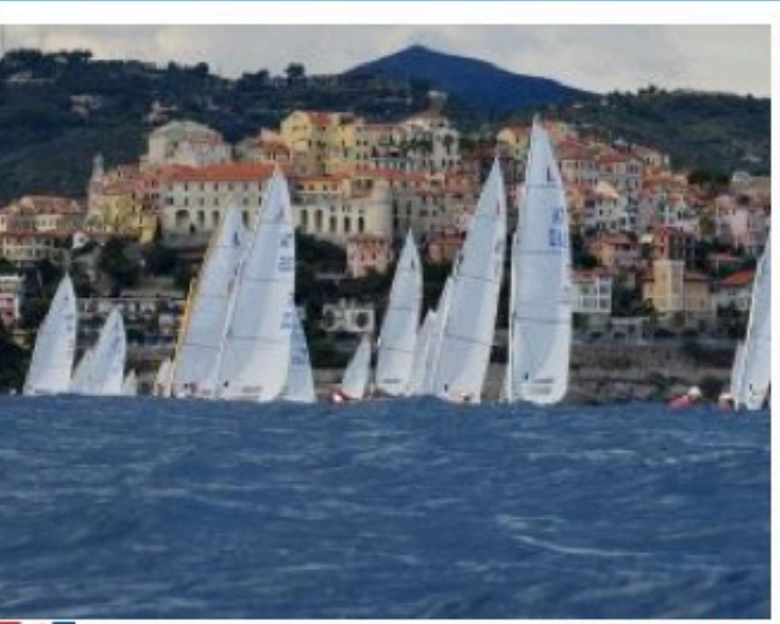
76 concorrenti per l'84° Campionato Italiano classe Dinghy 12' 10/09/2019 08:33