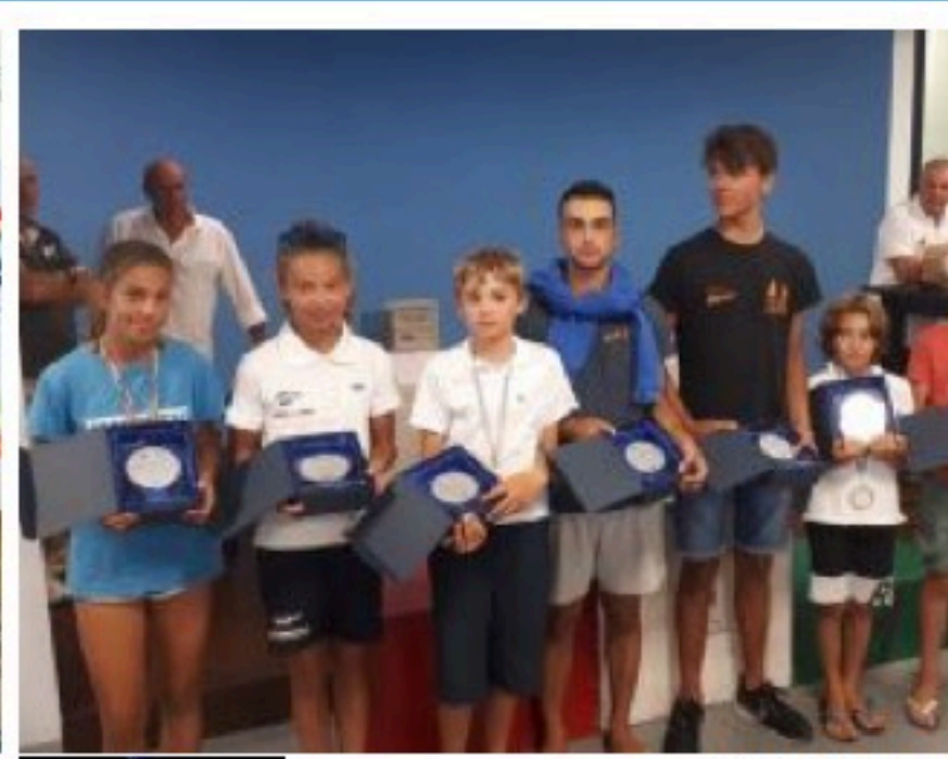
Campionato Regionale delle classi Giovanili, oltre 100 baby velisti 09/09/2019 18:51