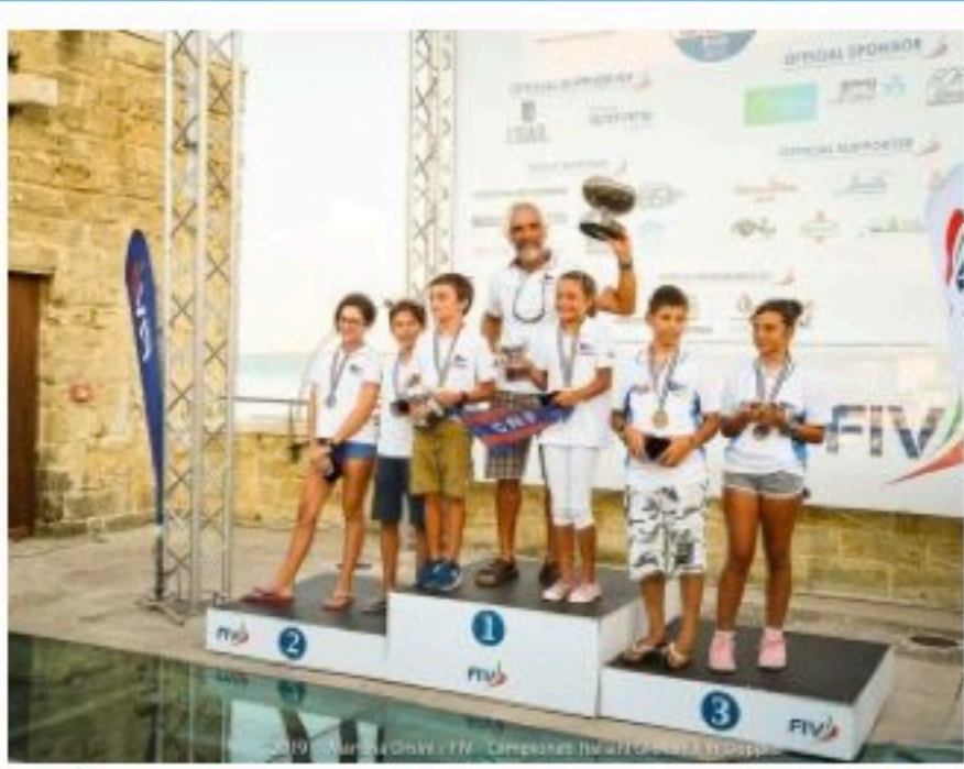
Conclusi oggi i Campionati Italiani Giovanili in doppio 2019 10/09/2019 08:17