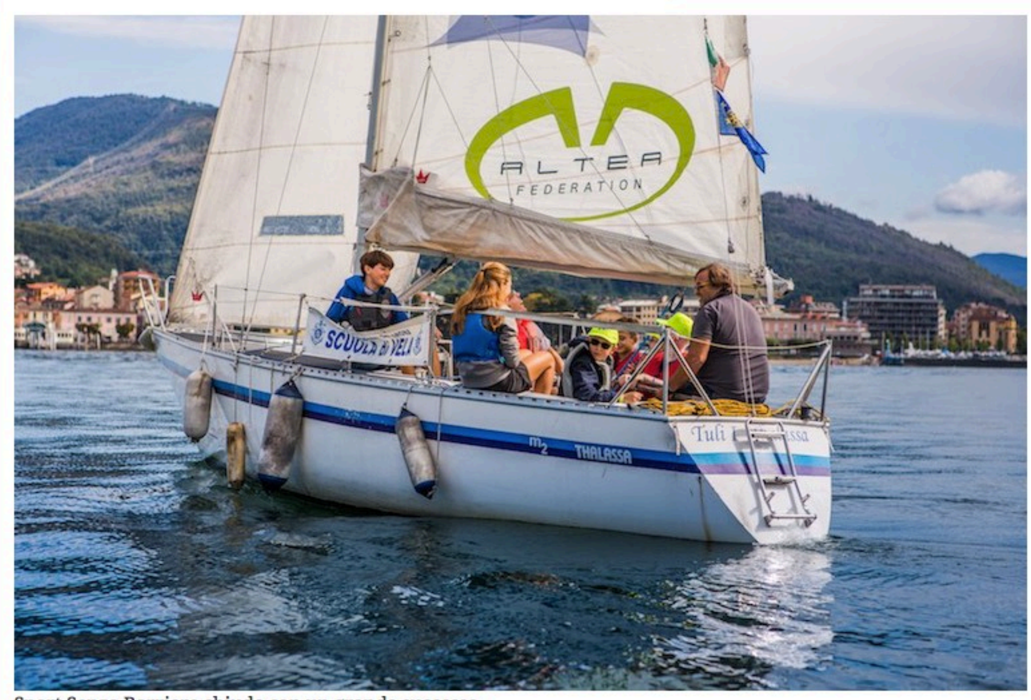
Sport Senza Barriere chiude con un grande successo

Conclusa a Luino la tre giorni dedicata all'inclusione tramite la pratica sportiva organizzata dalla Federazione Nazionale Sport e Tempo Libero di Unimpresa