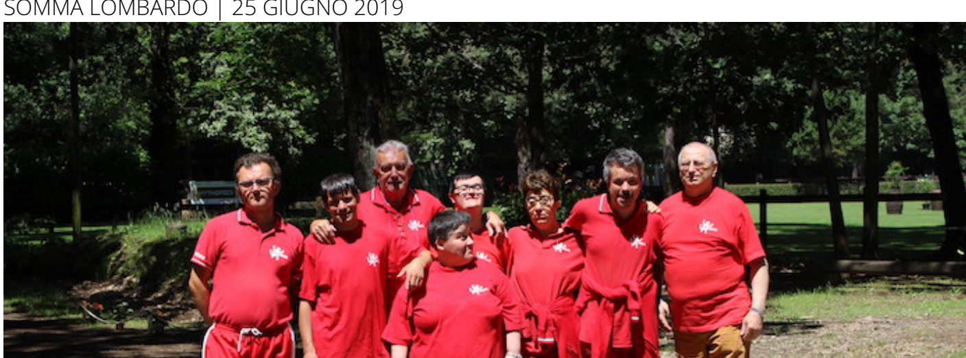
Luino notizie Redazione