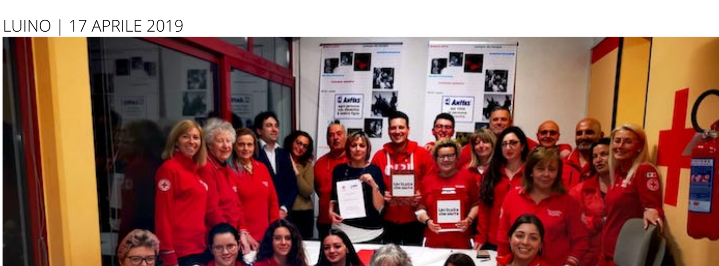
Luino notizie Redazione