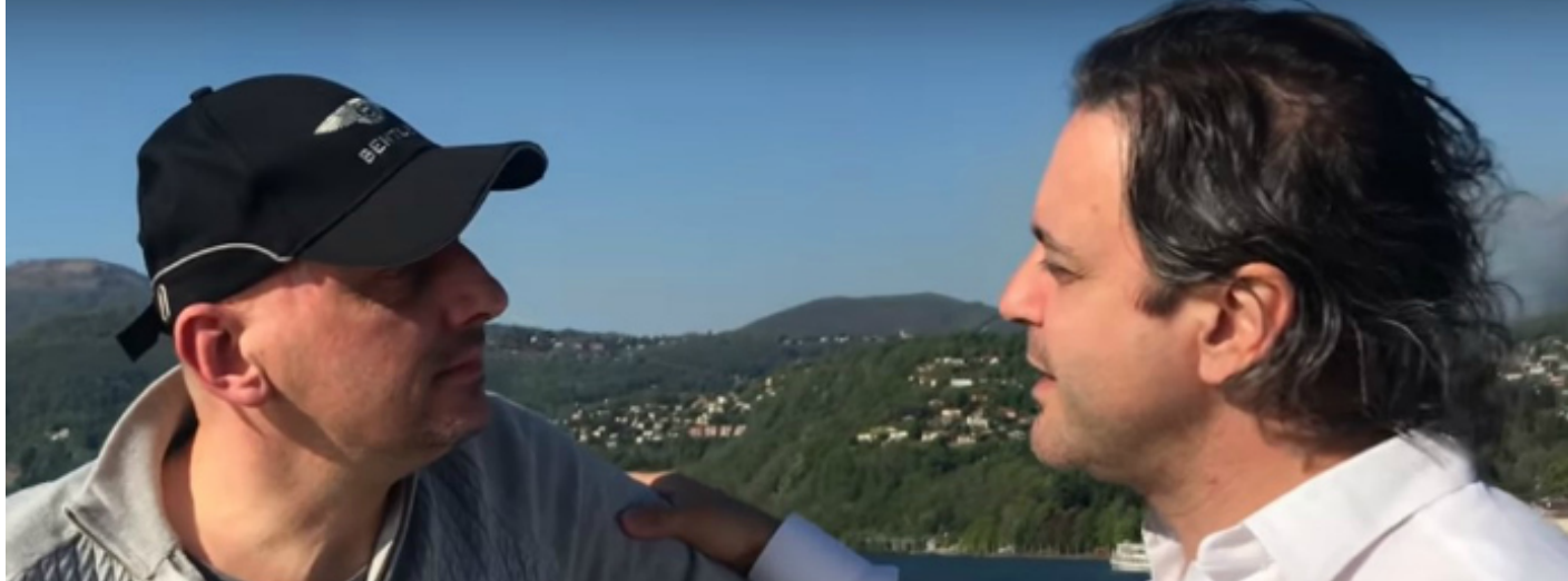
Luino notizie Redazione