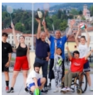
Sport senza barriere (clicca per ingrandire)

Link programma completo: Sport senza barriere