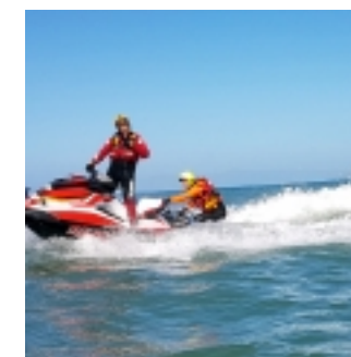
K38 Italia (clicca per ingrandire)