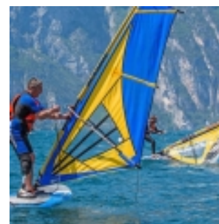
Windsurf (clicca per ingrandire)