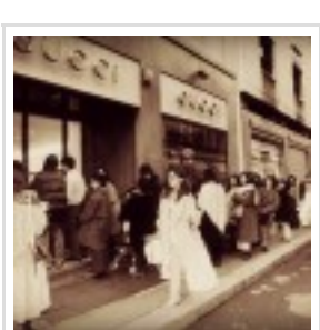
Shopping natalizio o count down per i saldi?