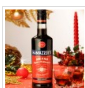
Cin cin sotto l'albero